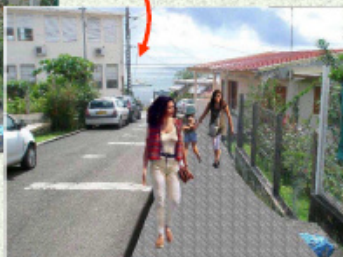
Le projet : un trottoir, niveau chaussée, fera la jonction entre l'église et le point de vue situé en contrebas.

Pour faciliter la circulation des véhicules dans la zone :