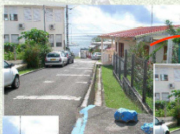
Aujourd'hui, le passage des piétons est difficile et dangereux entre l'église et le collège

Les abords du grand virage en direction du collège et de l'église seront réaménagés : un escalier conduit à une plateforme supérieure par laquelle les piétons accèdent à la partie haute de la piste piétonne. Cette plateforme est aménagée en point de vue. Ce projet fait partie d'un aménagement global destiné aux piétons. Du bas de la côte jusqu'à l'église un trottoir protégé est prévu.